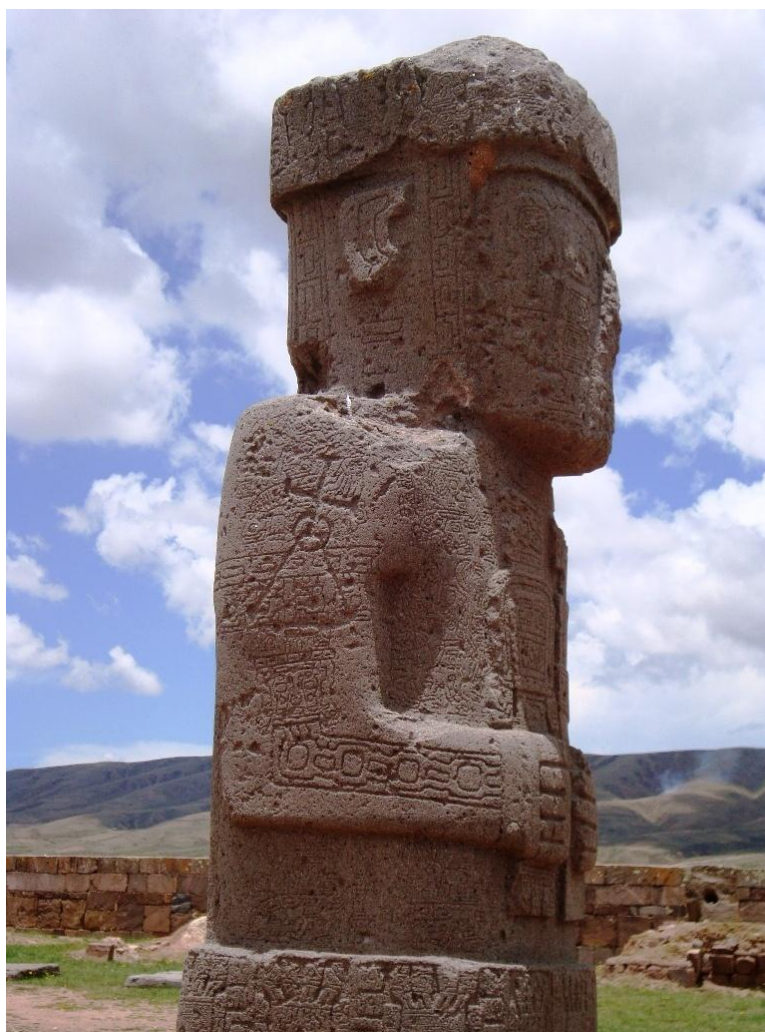
FIGURA 02 – MONOLITO PONCE

Na imagem, representativa de um chefe indígena, é possível observar uma inscrição na altura do braço, com uma cruz sobre três pontos, em forma triangular, representando a santíssima trindade. Nos autos de fé, no século XVI, com o objetivo de extirpar costumes, considerados idolatrias, objetos indígenas, relacionados à religiosidade, eram destruídos em eventos públicos, com o propósito de mostrar a superioridade do cristianismo e desacreditar os xamãs. Montoya (1997, p. 117) mencionou, no Guairá, caso semelhante, em que ossos de índios guarani foram queimadas na praça da redução. No caso do monolito Ponce, observa-se que quando a destruição não era possível, promovia-se a exorcização da peça, em um processo de demonização do que acreditavam ser incompatível com o cristianismo. Assim os fundamentos históricos da atuação dos missionários catequistas entre os índios do Itatim não são peças destacadas da estrutura colonial pregressa.